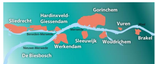
Met de water taxi