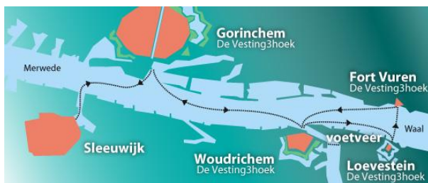
Met de veerdienst

Na 6 minuten lopen ziet u aan de linkerkant, recht voor u Hipper & Kolfbaan.